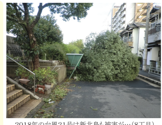
2018年の台風21号は新北島も被害が... (8丁目)

年々台風が狂暴化、暴風時は外に出ない、窓から離れて! マンションでも、飛来物で窓が割れることがあります。大型台風の際には、できれば窓に養生をしたあとカーテンをひいてガラスの飛散を少なくします。戸建ての方も、家まわりの飛びそうなものはしっかり固定してください。 ベランダや外の鉢等は飛ばないように撤収を