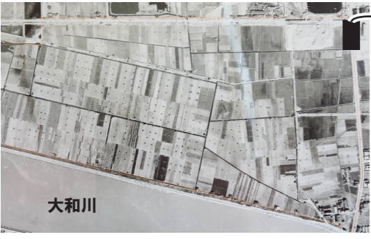
63年前(1958年)の新北島の航空写真(畑ばかり...)

ポイント 新北島の街が生まれてまだ約47年。250年位前まで海だった当地は、埋立地や干拓地として地盤が出来上がっているため、地震には弱く「ゆれやすく」「液状化が心配な」土地と言えます。また当地の地下には「住之江撓曲」とよばれる上町断層と関連した活断層もあるそうです。南海トラフ巨大地震、東南海・南海地震、上町断層帯地震と今後甚大な地震が懸念される当地では、つねに地震対策をおろそかには出来ません。