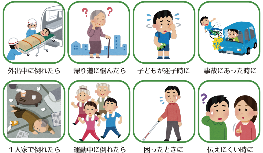
外出中に倒れたら

健康に不安のある人やご高齢の方から 子どもまで、外出中のもしもの時に、迅 速に的確に対応してもらえるように… 携帯しやすいお守りがわりの安心カード 「救急・緊急用本人記録カード」です。 ぜひご活用ください。 (くわしくは裏面をご覧ください)